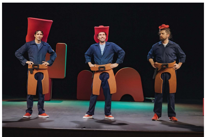
V predstavi Budale občinstvo izmenjaje spremlja razmišljanja igralcev o človeški neumnosti in pa skeče, ki nasmejejo do solz!