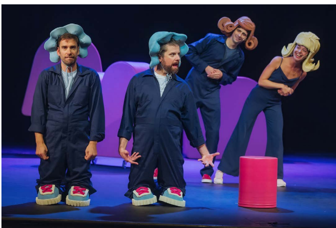
Dojenčki ali mame – kdo je tu bolj neumen?